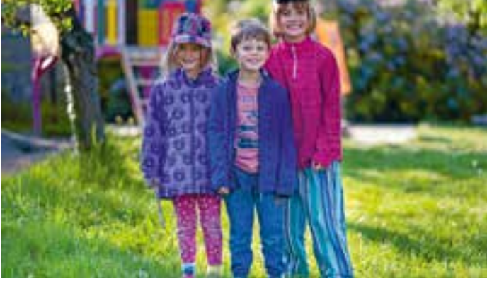
Abbildung 19: Die Kinder treffen im NAKI ihre Freunde und Freundinnen.