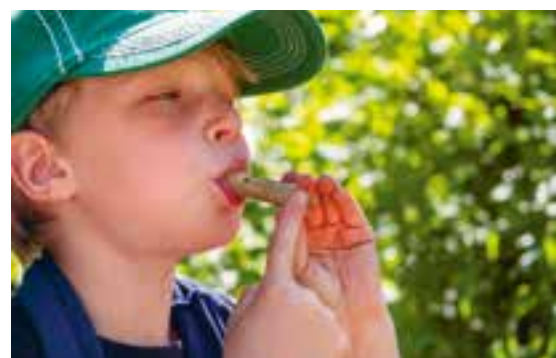
Abbildung 8: Die Natur wird mit allen Sinnen erkundet.

Gemeinsames Singen und Musizieren fördert nicht nur das soziale Lernen und die Kontaktfähigkeit, sondern wirkt sich zudem auch positiv auf die Sprachentwicklung der Kinder aus. Die kindliche Freude daran, Töne zu produzieren und zu entdecken, kann in gemeinsamen Musik- und Singkreisen gut aufgegriffen werden.