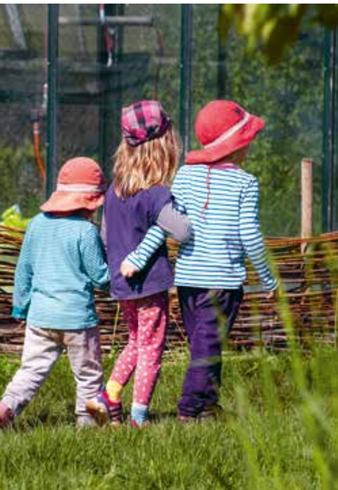
Abbildung 30: Rollenspiele entstehen.