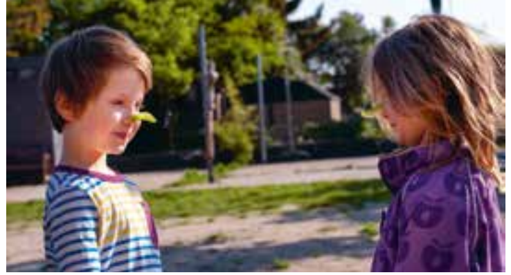
Abbildung 15+16: Kinder kommen im Freispiel auf die schönsten Ideen.

Darauf aufbauend sind die Kinder der Ausgangspunkt für die Bildung: Sie zeigen uns, für welche Themen sie sich interessieren. Kinder suchen nach neuen Erfahrungen und Erlebnissen. Darauf gehen wir ein.