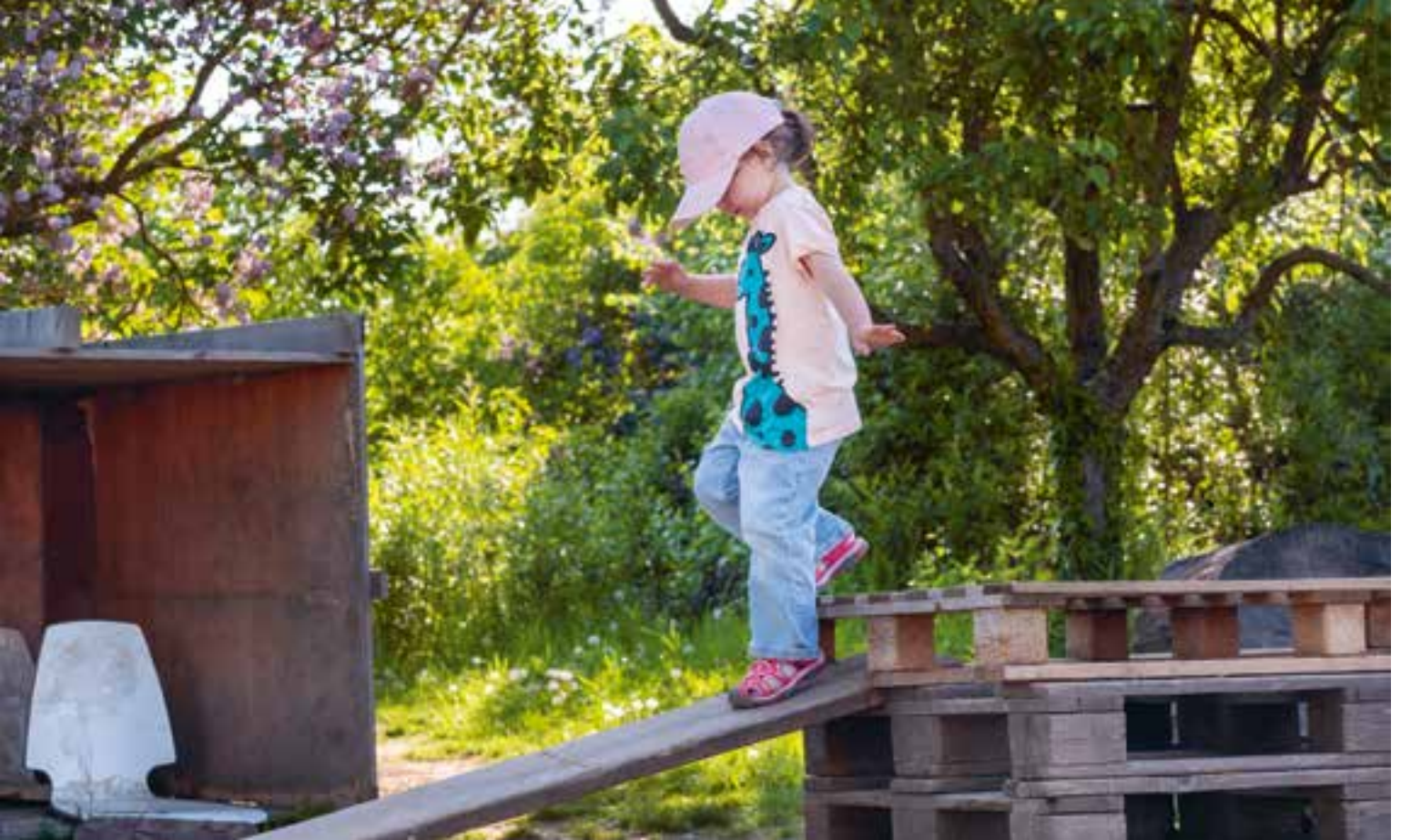
Abbildung 40: Ängste und Unsicherheiten überwinden.