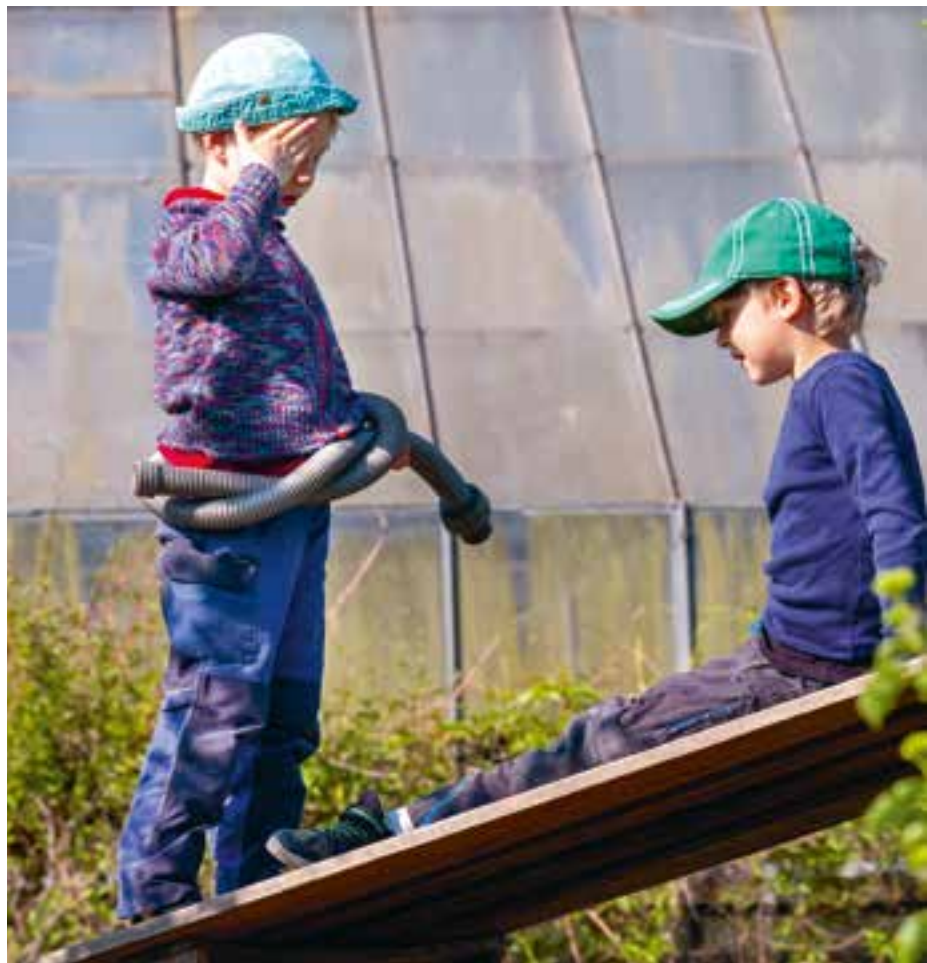
Abbildung 33+34: Bei uns können sich die Kinder vielfältig ausprobieren.