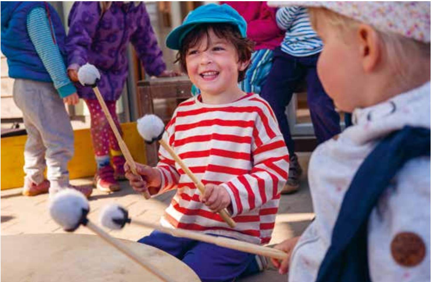
Abbildung 32: Musizieren macht allen Kindern große Freude.