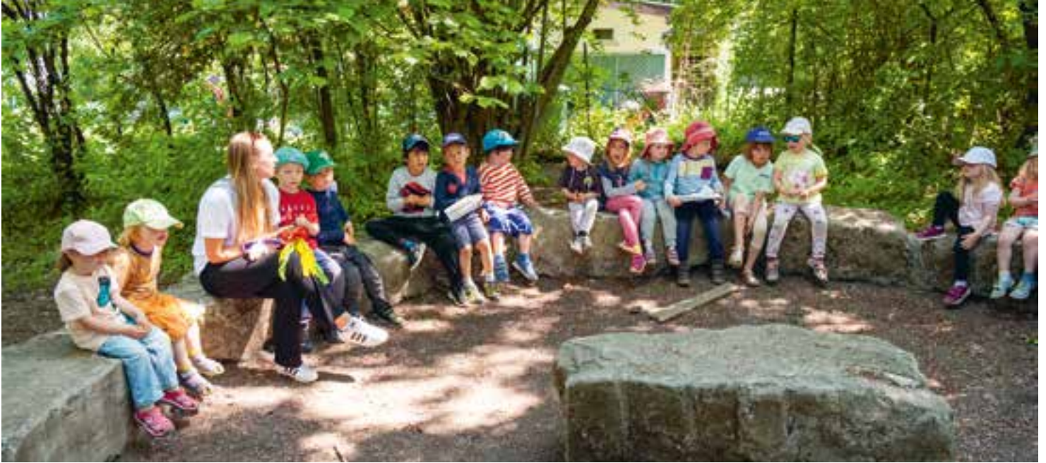
Abbildung 6: Im Alltag nutzen wir Lautsprachunterstützende Gebärden.