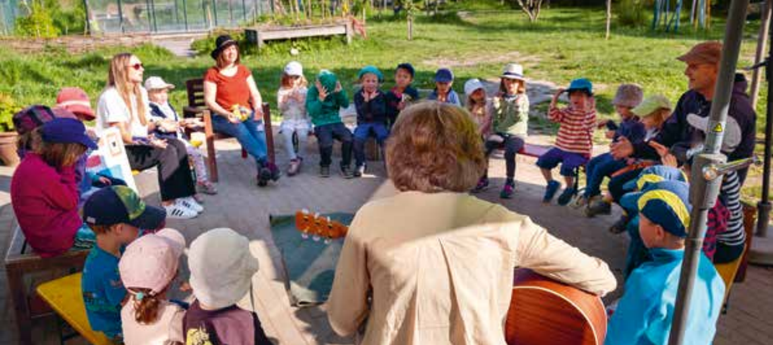
Abbildung 23: Musik und Gesang begleiten uns in unserer täglichen Arbeit.