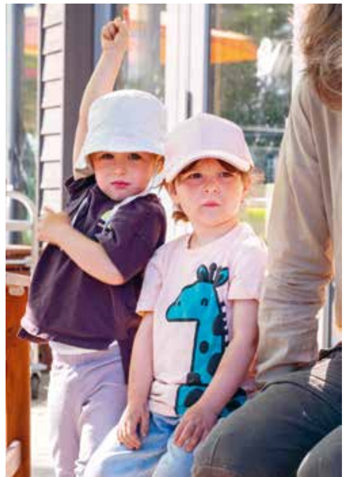
Abbildung 13: Beteiligung durch Fragen, Zuhören und nach Antworten suchen.

Diese wertebasierte Erziehung bildet in den Kindern auch die Grundlage für ein Demokratieverständnis. Denn die Kinder lernen, Verantwortung für ihr Handeln zu übernehmen und sich zu beteiligen.