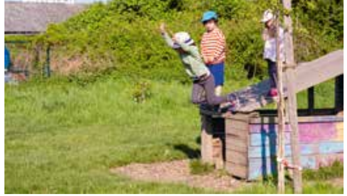
Abbildung 18: Bereit zum Absprung – unsere Abschlussgruppe.