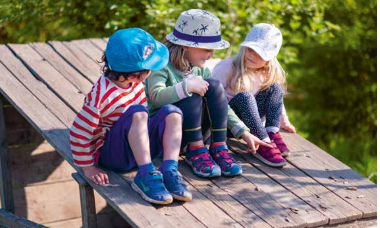
Abbildung 36+37: Die meiste Zeit des Tages spielen die Kinder gruppenübergreifend auf unserem Außengelände.