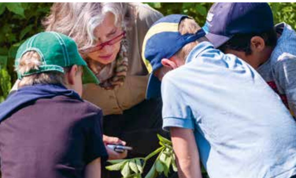
Abbildung 9: Wir unterstützen den Entdeckungsdrang der Kinder.

Wir ermöglichen unseren „forschenden“ Kindern Zugang zu verschiedenen Materialien, damit sie je nach Interesse und Wissensstand selbstbestimmt Erfahrungen sammeln können. So können sie bereits im Vorschulalter die ersten Wenn-Dann-Beziehungen herstellen und sind damit gut für den Übergang in Kindergarten und Schule vorbereitet