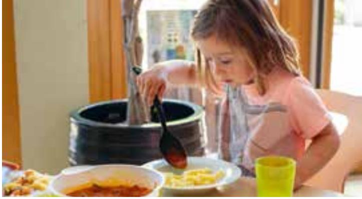
Abbildung 26: Die Kinder nehmen sich das Essen selbst.