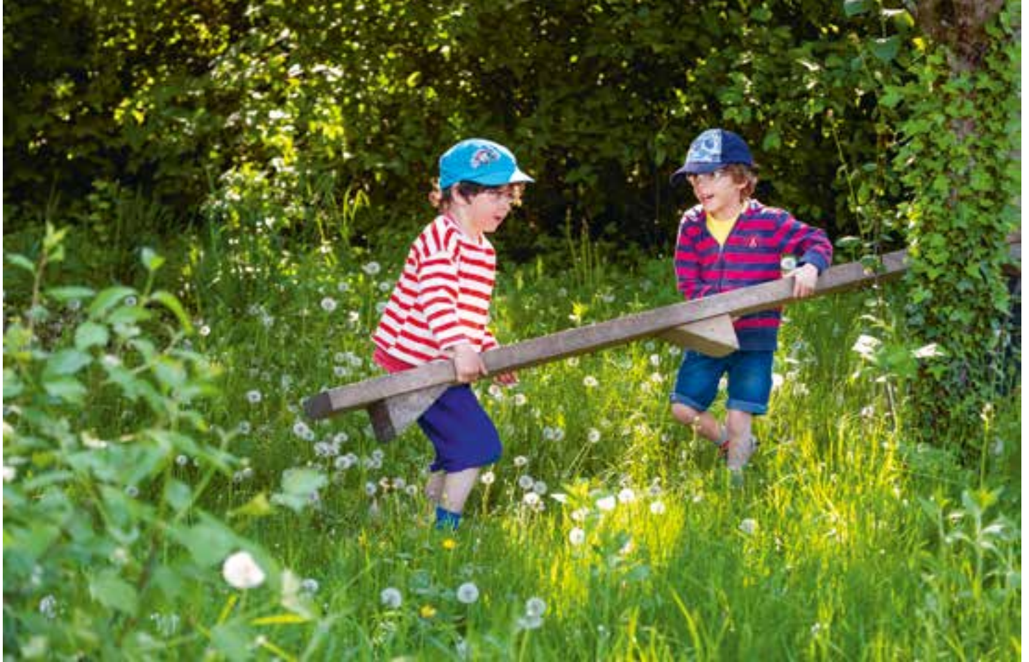
Abbildung 4: Zusammen sind wir stark!