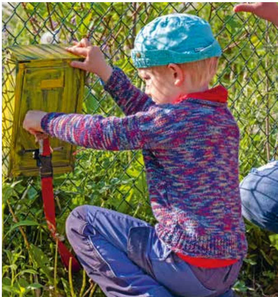
Abbildung 31: Haben wir einen Brief für die Kinderkonferenz?