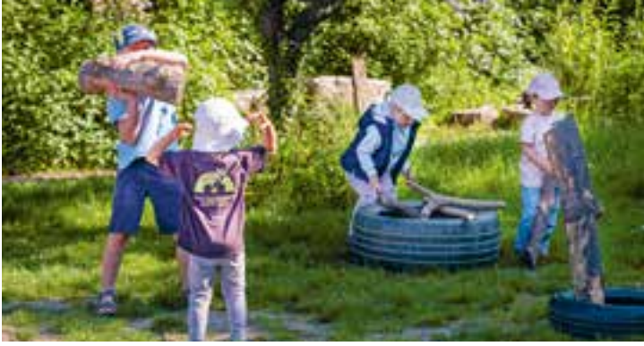
Abbildung 2+3: Jedes Kind trägt einen Teil zu unserer Gemeinschaft bei.