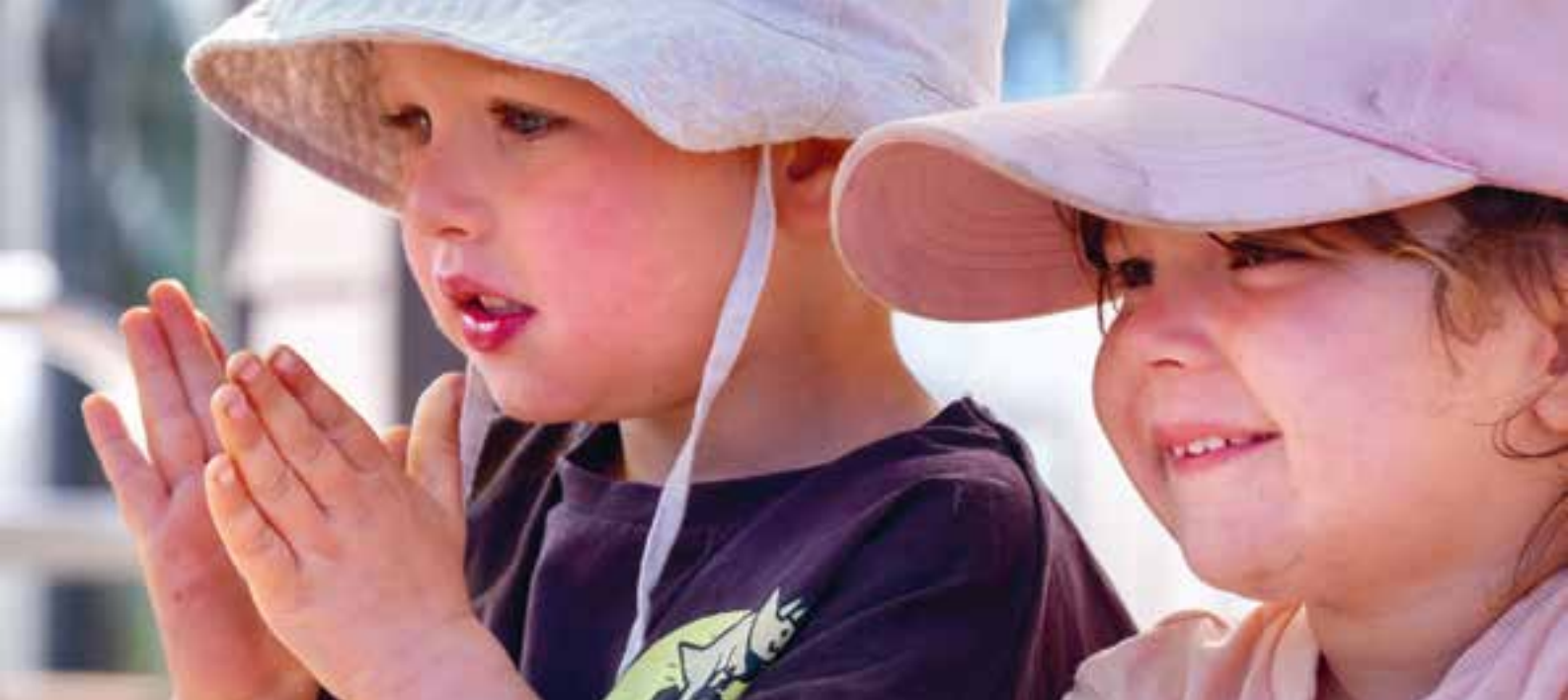
Abbildung 21: Jedes Kind wird in Entscheidungen miteinbezogen.

Dazu gibt es die Möglichkeit, regelmäßige Gespräche zu führen und gemeinsame Vereinbarungen zu treffen. Wir möchten die Eltern kennenlernen und ihnen die Möglichkeit geben, uns kennenzulernen. Wir legen Wert darauf, offen über unsere Arbeit zu berichten, z. B. durch Elterninformationen oder Pinnwände.