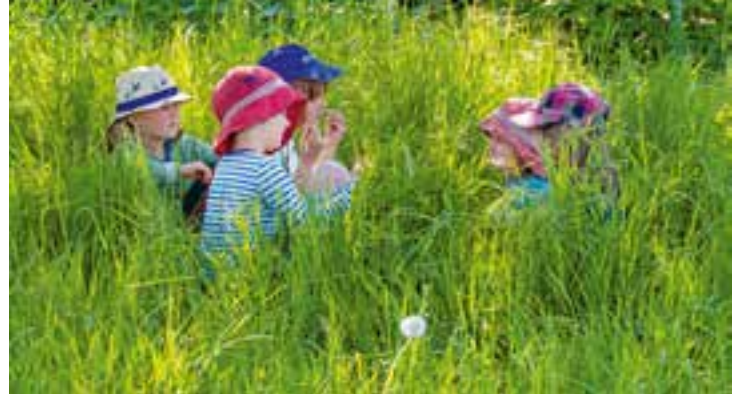
Abbildung 25: Blumen und Gräser laden zum Verweilen und Entspannen ein.

einem geschützten Rahmen Erfahrungen mit den Hunden zu sammeln. In Kleingruppen wird sich mit dem Wesen, Verhalten und den Charakteren der Hunde spielerisch beschäftigt.