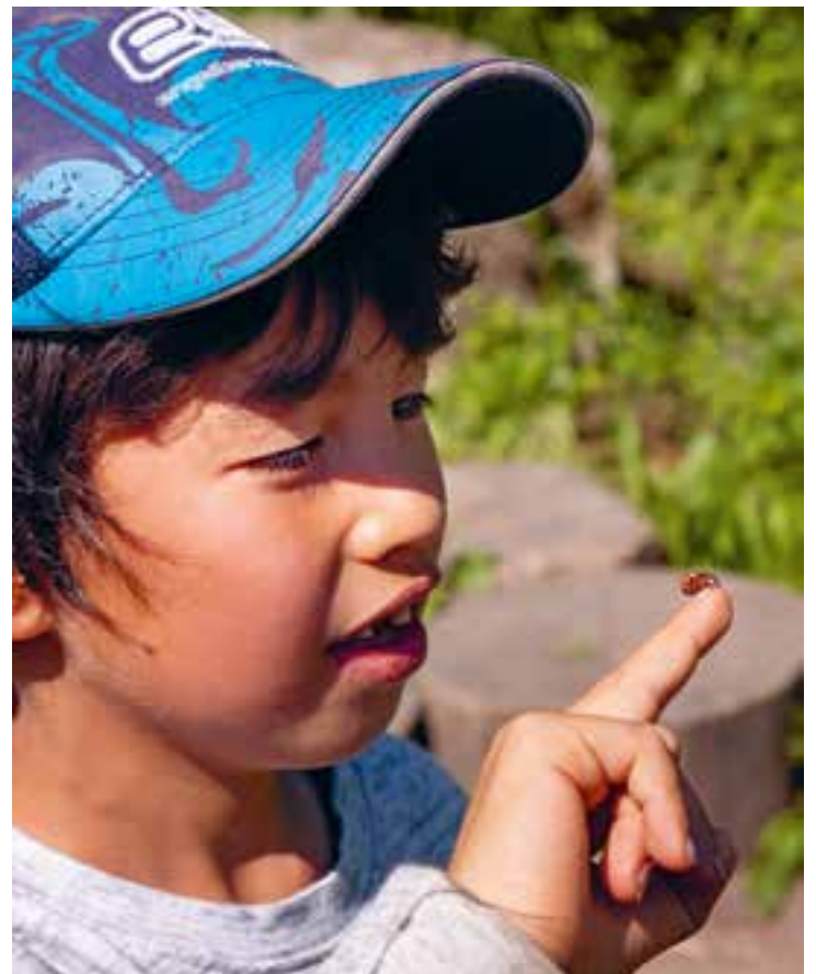
Abbildung 5: Beim Gärtnern nehmen wir Rücksicht auf alle Lebewesen.

Wir haben einen Bauerngarten, in dem wir Obst und Gemüse gemeinsam mit den Kindern anbauen und beim Wachsen zuschauen. Durch das Säen, Gießen und Pflegen der Pflanzen sowie dem Ernten und Weiterverarbeiten der angebauten Lebensmittel zu Marmeladen oder Suppen lernen die Kinder viel über gesunde Nahrungsmittel und Ernährung.