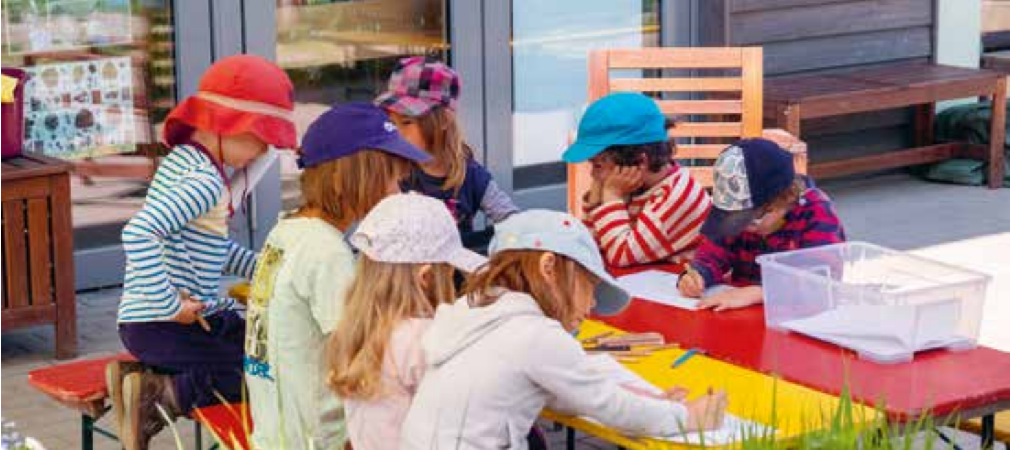
Abbildung 7: Auch unsere Kreativangebote finden draußen statt.