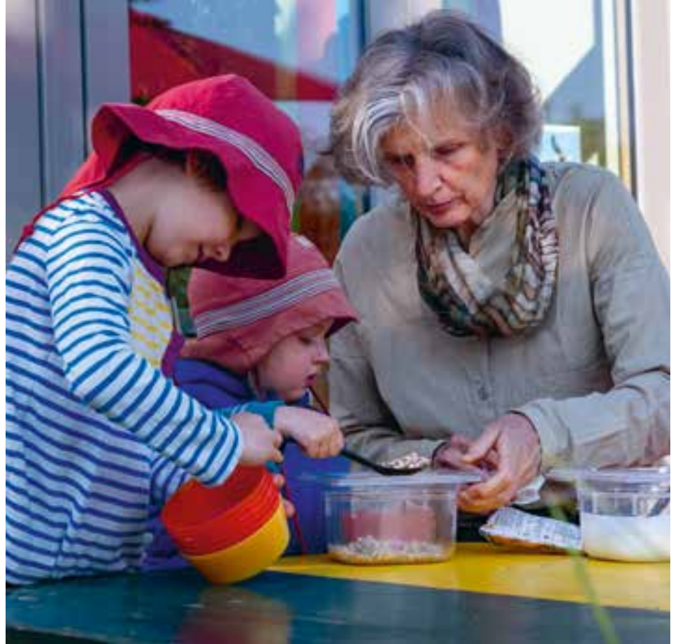
Abbildung 38+39: „Ich kann das schon alleine.“