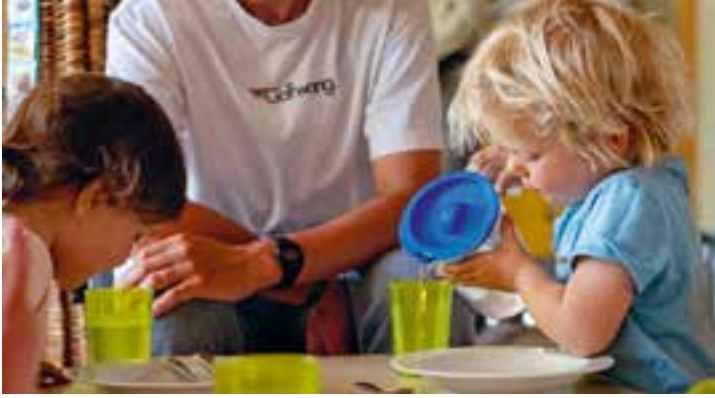
Abbildung 17: Wir helfen den Kindern auf ihrem Weg zur Selbständigkeit.