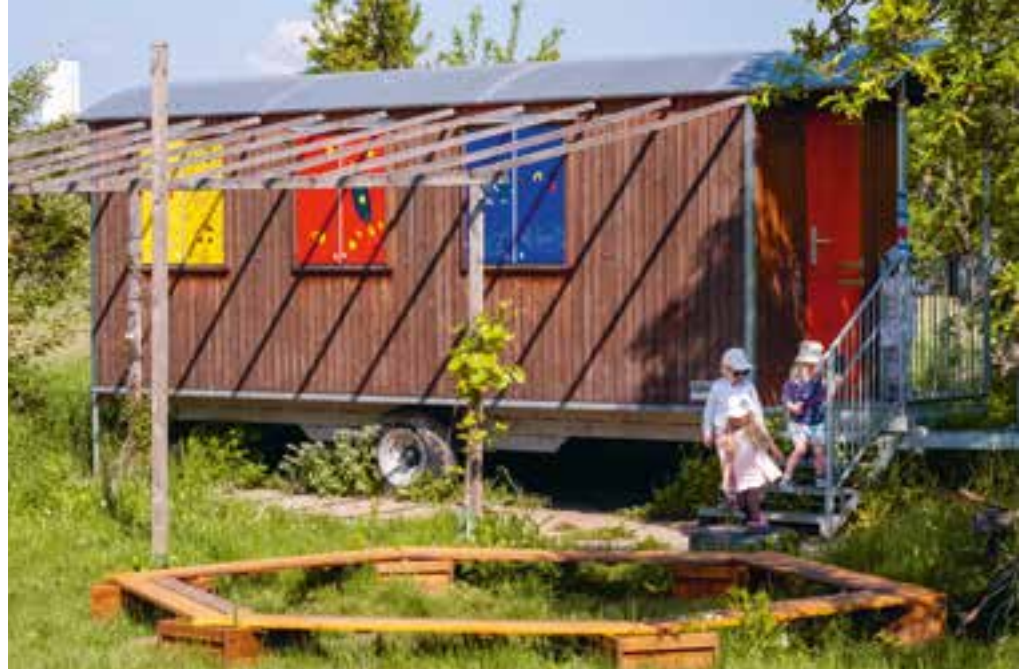
Abbildung 28+29: Der Bauwagen auf unserem Gelände dient als Rückzugsort für kleinere Spielgruppen.