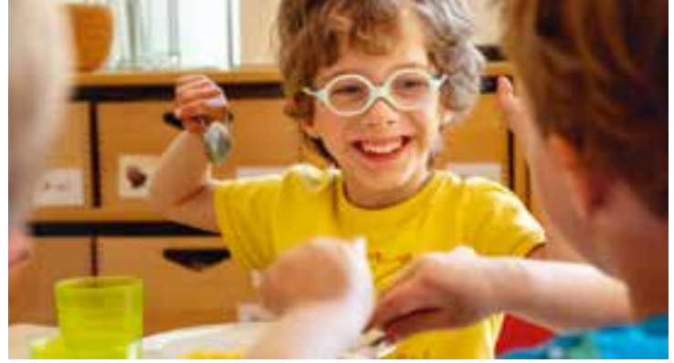
Abbildung 27: Auch während des Essens ist Zeit für Austausch und Gespräche.

Wochentag benannt, Tagesabläufe besprochen, Pläne geschmiedet, über Vorschläge abgestimmt, Lieder gesungen und Spiele gespielt. Die Kinder lernen, sich als Gruppe wahrzunehmen, konzentrieren sich und hören zu. Sie lernen, sich in einer Gruppe zu verhalten und zu artikulieren und bekommen ein Verständnis von Mengen, Zahlen, Zeit, Abläufen und demokratischen Strukturen. Aber auch die Motorik, kognitive, soziale und emotionale Bereiche werden hier angesprochen und gefördert. Einmal pro Woche findet anstelle der Morgenkreise eine gemeinsame Kinderkonferenz statt. Hier werden Themen und Anliegen der Kinder und Erwachsenen, wie zum Beispiel eine bevorstehende Aktion oder Regeln, besprochen. Die Kinder lernen hierbei, ihre Anliegen einzubringen, miteinander zu diskutieren und gemeinsame Lösungen in der Großgruppe zu entwickeln.