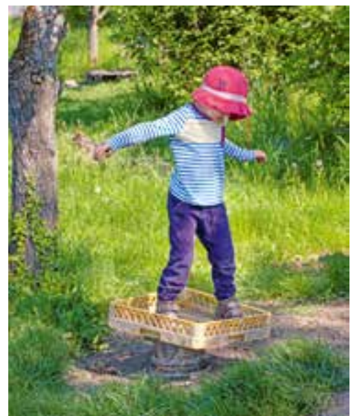
Abbildung 10: Wie lange kann ich die Balance halten?