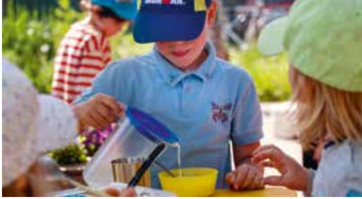
Abbildung 24: Unser offenes Frühstück findet meistens draußen statt.