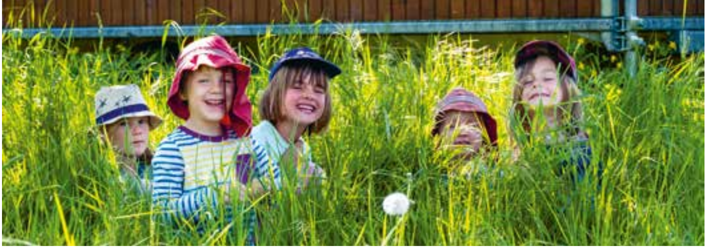
Abbildung 35: Zeit, gemeinsam fröhlich zu sein.