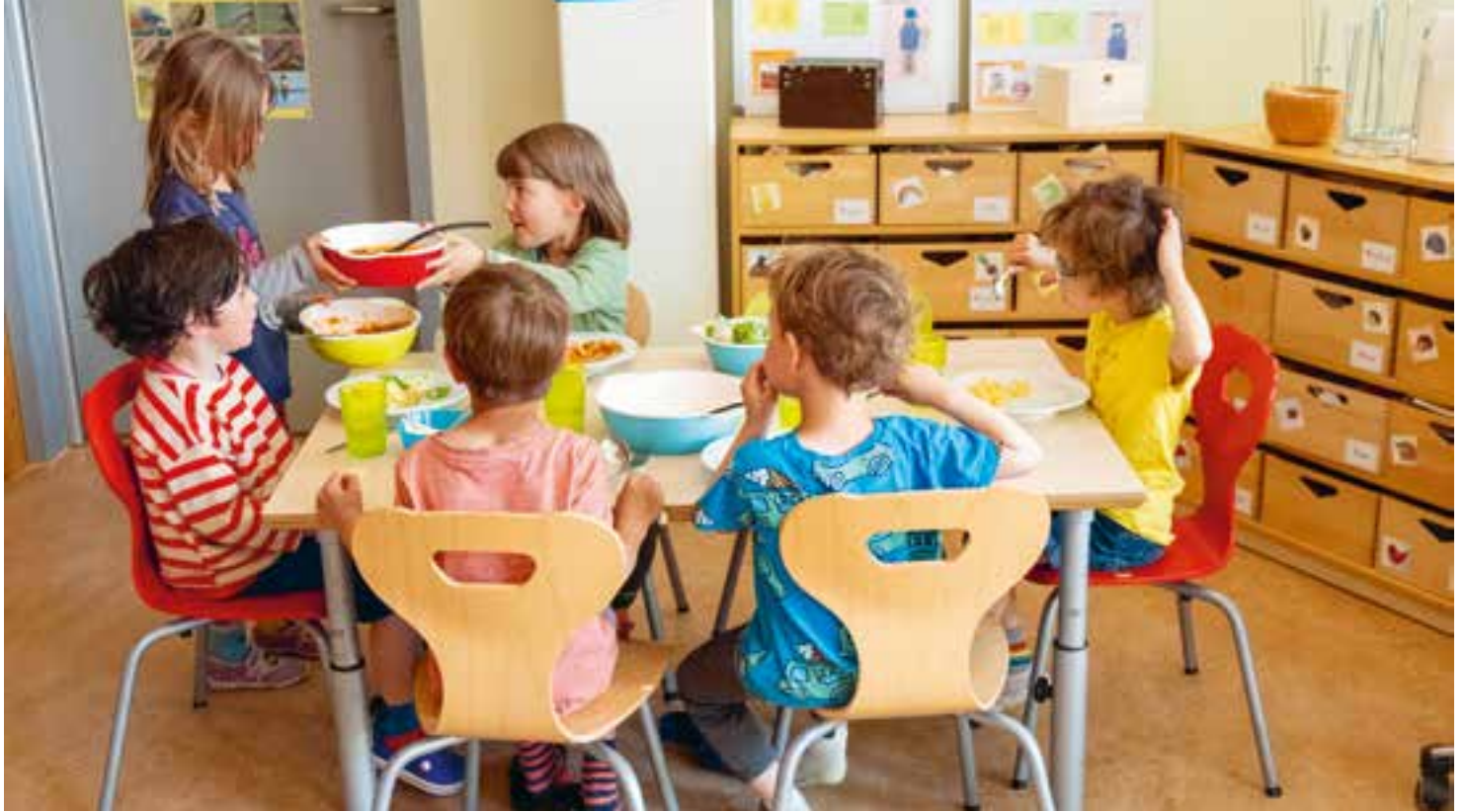
Abbildung 42: Die Kinder wechseln sich beim Tischdienst ab – so sieht Kooperation aus.