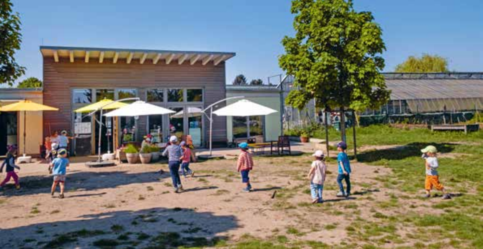
Abbildung 41: Unsere Bäume und Schirme spenden uns im Sommer Schatten.