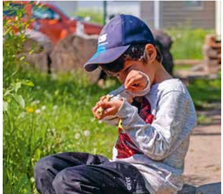
Abbildung 1: Die Natur inspiriert die Kinder dazu, Neues auszuprobieren.

Das Hochklettern auf unseren Kletterbaum ist für viele Kinder eine Herausforderung. Wir unterstützen die Kinder beim Ausprobieren, setzen sie aber nicht auf einen Ast. Die Kinder versuchen es dann so lange, bis sie es eigenständig geschafft haben. Wir begleiten sie dabei, indem wir sie anfeuern und anleiten.