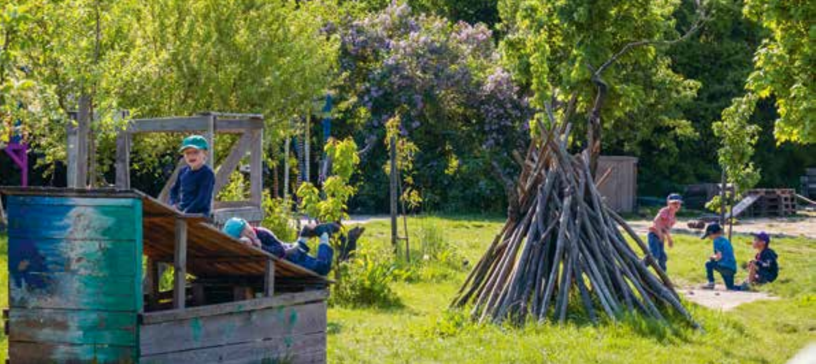
Abbildung 22: Unser weitläufiges Außengelände lädt zum freien Spielen ein.