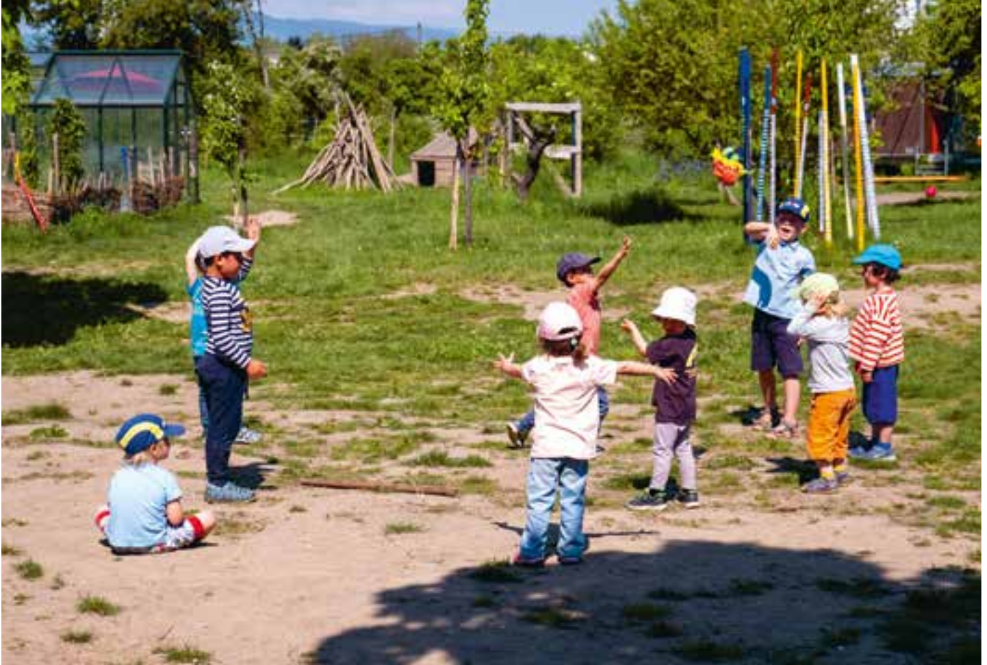
Abbildung 12: Die Kinder sind ganz individuell und gleichzeitig Teil unserer Gemeinschaft.