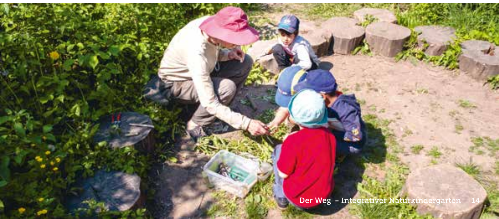
Abbildung 14: Wir greifen die Interessen der Kinder auf und begleiten sie dabei.

Wir leben einen geregelten Tagesablauf, bei dem die Kinder Stabilität erfahren und sich so auf neue Bildungsprozesse gut einlassen können.