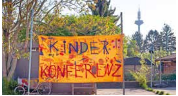
Abbildung 20: Für alle gut sichtbar: Heute findet unsere Kinderkonferenz statt.